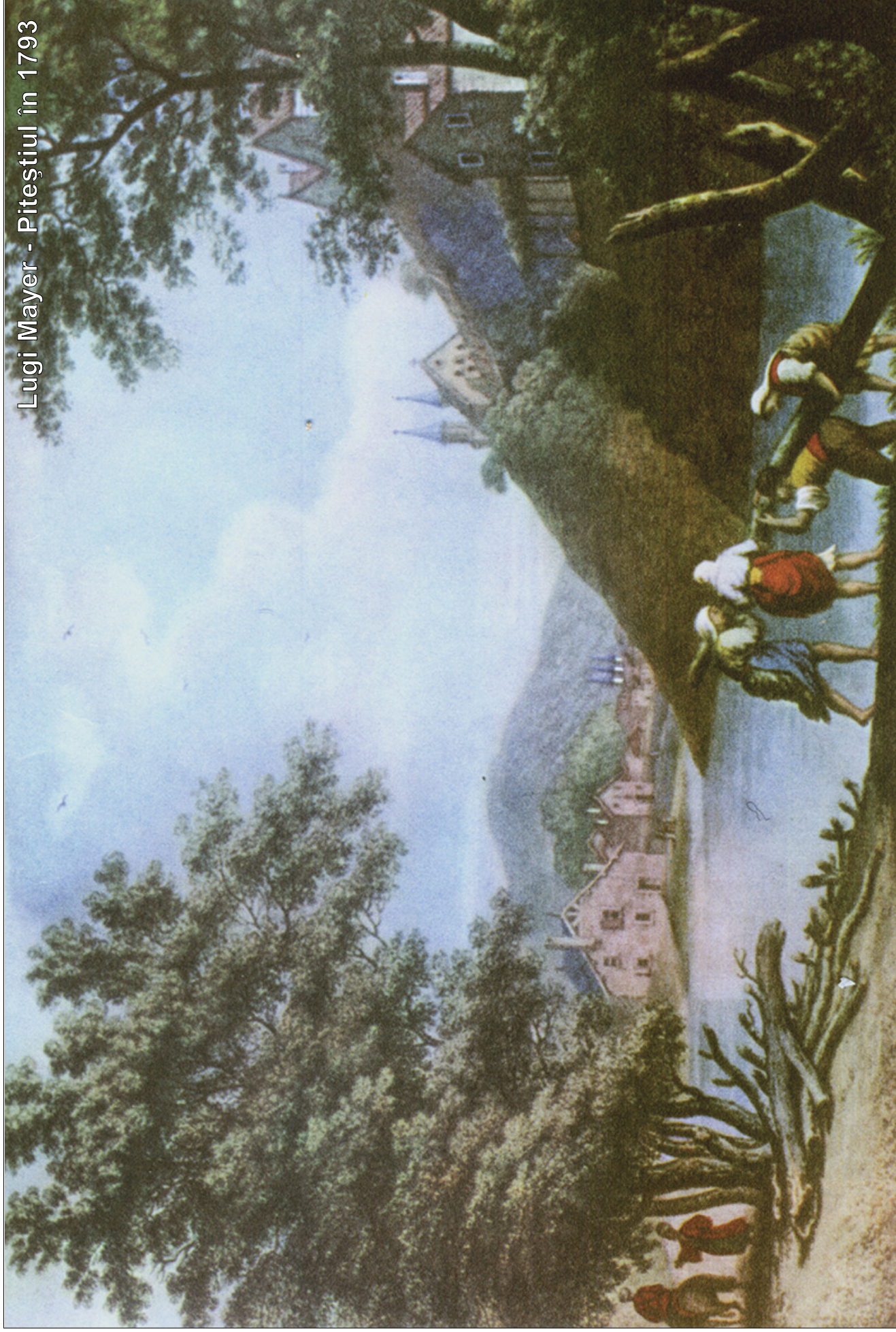
Lugi Mayer - Piteștiul în 1793