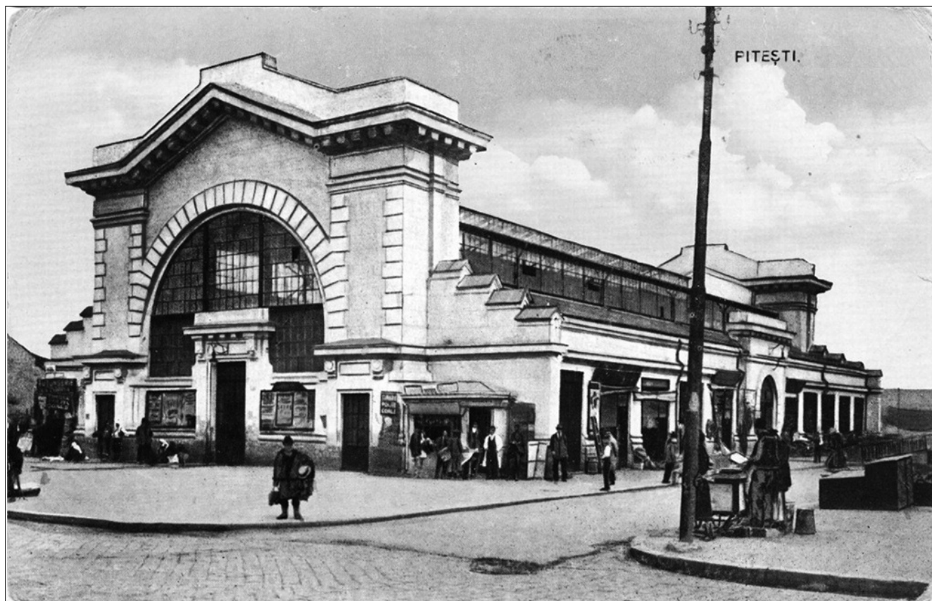
Hala de carne