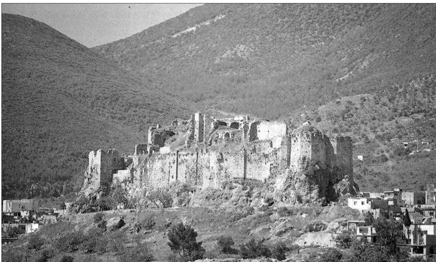
Cetatea Hașișinilor de la Masyaf

Scopul primordial al Asasinilor era uciderea prin atentate a căpeteniilor sumnite , a celor de la Alep, a guvernatorilor Apameei, Hamei și Homsului care i se opuneau. Din ordinul Bătrânului din Munte a fost asasinat și marele vizir Nizam el-Molk, despre care vorbește în Samarcand Amin Maalouf. Concomitent, asasinii s-au întors împotriva căpeteniilor cruciate, ucigându-i pe Raymond al II-lea de Tripoli și pe Conrad Monferat, regele Ierusalimului, înjunghiat în seara premergătoare încoronării. Adversarul cel mai temut al asasinilor, sultanul Saladin, se afla în fruntea listei celor care trebuiau asasinați, însă din toate cele trei atentate a scăpat cu viață și doar cu câteva zgârieturi. La rândul său, Saladin a încercat să cucerească cetatea Asasinilor, însă fără sorti de izbândă. Până la urmă, cei doi au încheiat un pact și