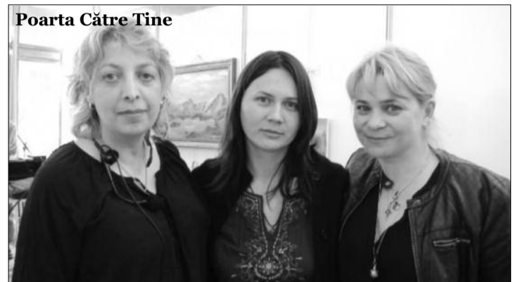
Poarta Către Tine