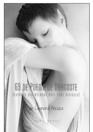
LEONARD ANCUȚA 69 de poeme de dragoste [extrase din atlasul unei lumi dificile] Ed. Herg Benet 2013

...lipsită de orice tam-tam în privința concepției și poeticii implicite, Leonard Ancuța a continuat să-și scrie nestingherit poezia, care, fără a-și schimba fundamental nutrienții sau limbajul frisonului fizic, astăzi, are deja o altă față.