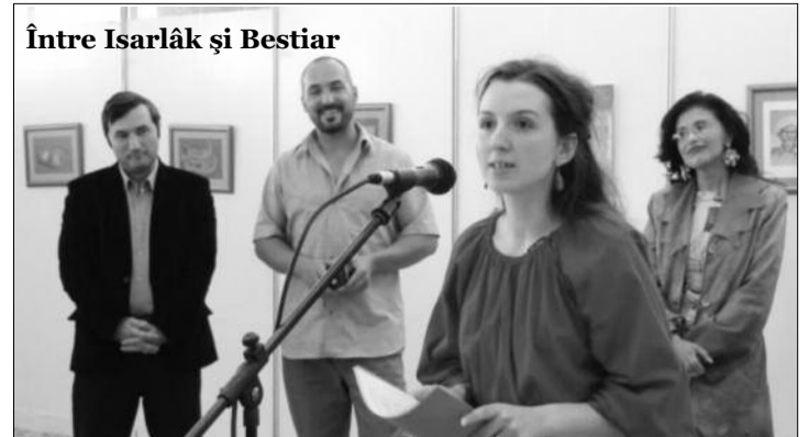
Între Isarlâk și Bestiar

■ Atmosferă de sărbătoare câmpenească în centrul Piteștiului. Primăria Municipiului Pitești și Consiliul Local organizează în perioada 10 - 19 octombrie, în Piața Vasile Milea, târgul „Toamna Piteșteană”. Tradiționala manifestare cuprinde o expoziție cu vânzare de produse agro-alimentare, legume, fructe, must, terase cu mici, pastramă și alte derivate din carne, dar și spectacole de muzică, pentru toate gusturile. Târgul „Toamna Piteșteană” a fost inaugurat de oficialitățile județene și locale, care au vizitat expoziția și au cumpărat câte ceva din