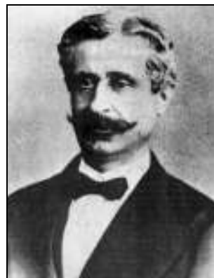
Dumitru C. Brătianu (1891-1892)