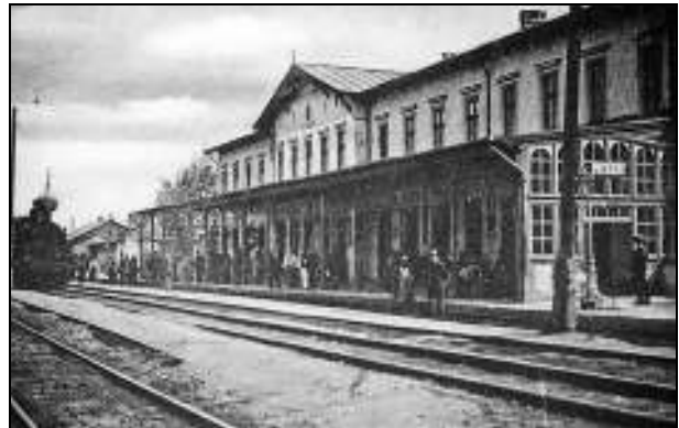
Gara din Pitești în anul 1900

aeroplanelor sunt mult mai mari asupra celor surprinși pe străzi sau în curți 7 . Comercianții vor trage obloanele prăvăliilor, lăsând însă oblonul ușei din mijloc jumătate tras și nu vor închide ușa cu cheia pentru ca trecătorii surprinși pe stradă, să se poată refugia imediat. Tot de asemenea persoanele particulare sunt obligate a nu închide ușile caselor, lăsând posibilitatea trecătorilor să se refugieze. Cei cari vor închide ușile, împiedicând publicul să nu se poată refugia în cazul când din bombardări vor rezulta răni sau ucideri de persoane vor fi dați judecatei ca părtași la ucideri cu voință. Circulațiunea pe strada principală, pe unde de obicei orașenii-și fac plimbarea va fi cât se poate de redusă și numai pentru cei cari au voe absolută să treacă, sau a face cumpărături de la magazine, fiind cunoscut faptul că aviatorii vrășmași aruncă bombe acolo unde văd circulațiunea mai mare; se interzice dar preumblarea fără interes pe strada principală (Șerban-vodă) cum și pe celelalte străzi. Asemenea pe piețe se interzice staționare publicului fără interes. Aceste măsuri, fiind luate în interesul personal, pentru a apăra viața cetățenilor, se va executa cu strictete de către autoritatea polițienească, în cazul când cetățenii nu-și cunosc singuri interesul de a se feri de moarte” 8 .