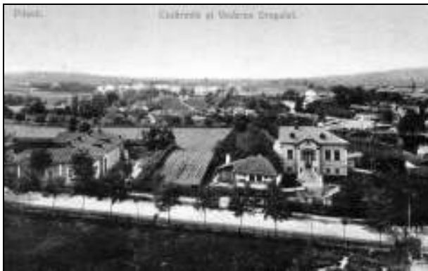
Vedere panoramică asupra cartierului militar, în plan îndepărtat se observă cazărțile regimentelor

În cele scrise despre urbea noastră, și aici mă gândesc mai cu seamă la cei care au încercat să reconstituie istoria acestei localități și a oamenilor săi, în centrul atenției s-a aflat vatra târgului, în mod explicabil, ceea ce mai târziu avea să devină zona centrală. Așa se face că hotarul de demult se regăsește prea puțin în preocupările celor meniți să povestească concitadinilor despre vremurilor trecute. Sau altfel spus, periferia ocupă un loc...periferic (dacă-mi este permis acest joc de cuvinte) în preocupările cronicarilor locali.