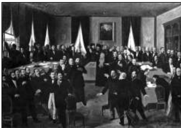
Theodor Aman – Proclamarea Unirii 1859

Unirea Țării Românești cu Moldova, înfăptuită la 24 ianuarie 1859, reprezintă actul politic ce stă la baza României Moderne și a formării națiunii române. Împrejurările nu au permis unirea simultană a celor trei țări române: Moldova, Țara Românească, Transilvania. Statul național român s-a format treptat, începând cu Unirea din 1859 și încheindu-se în 1918, când lupta de eliberare națională a poporului va fi încununată de victorie.