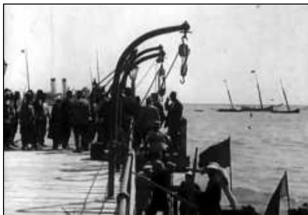
Oficialități locale civile și militare românești și străine, probabil la Balcic – cadru din film