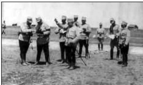
Fig. 6. – Generalul Ioan Culcer, comandantul forței militare secundare, de ocupare a Cadrilaterului, împreună cu șapte membri ai statului său major, discutând planurile pe teren și trasând indicații tactice – cadru din film

În continuarea filmării se observă un escadron de cavalerie în mișcare pe teren și artilerie de câmp tractată de cai, executând manevre. Tunurile sunt model 1904, calibrul 75 mm, cu echipaj de 6 servanți și tractate de 6 cai.