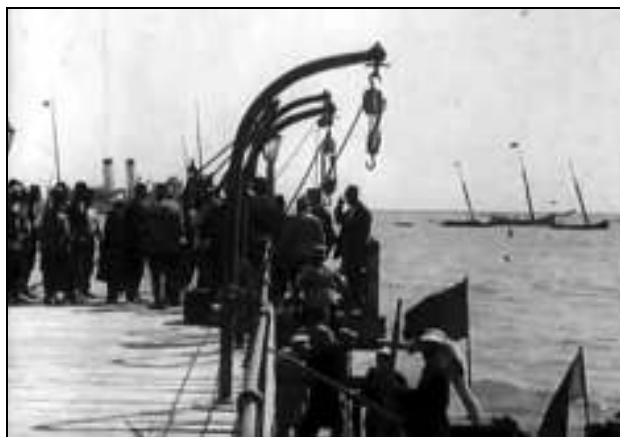
Fig. 5. – Oficialități locale civile și militare românești și străine, probabil la Balcic – cadru din film

Următoarele imagini sunt filmate la Dobrici (Bazargic), unde era staționată artileria. Se observă tabăra, cavalerie, trupe și un ofițer călare ce scrie o depeșă pe care o înmânează unui curier călare pentru transmitere. Se succedă imediat imagini cu militari la malul mării, probabil la Balcic iar în alte imagini apar militari, oficiali români și musulmani pe un ponton pentru o ceremonie oficială.