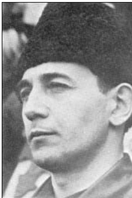
Boboteaza anului 1941. Ultima fotografie oficială a lui Horia Sima