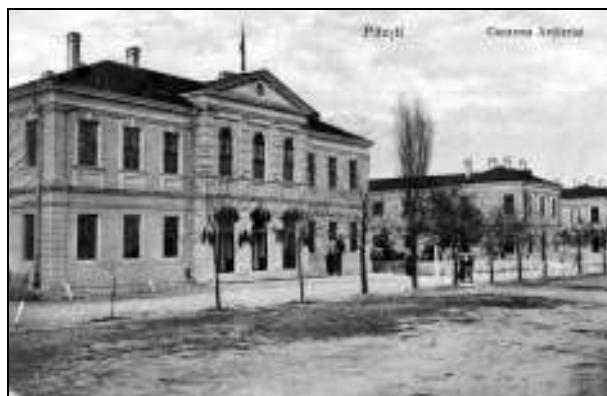
Cazarma Regimentului 6 Artilerie

Generalul Arion, comandantul Corpului 2 Armată, a ordonat pe 31 mai 1898 ca pentru tranșarea acestei chestiuni, mai întâi să facă o somațiune prin Portărei, prin care să i se dea un termen convenabil pentru mutarea împrejuririi sale pe adevăratele hotare. În caz că nu s-ar fi supus, Garnizoana primea autorizația de a se ocupa cu mutarea împrejuririi în exacta locație, executând lucrarea cu soldați și meseriași 5 . Somațiune ce a fost pusă în aplicare 6 .