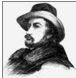
Nicolae C. Golescu (desen)