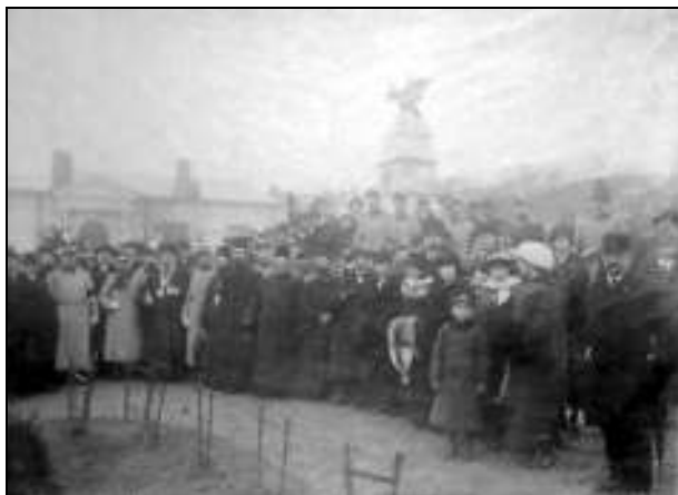
Fig. 1. – Monumentul eroilor Campaniei din Bulgaria, 1913 (Regimentul 6 Artilerie din Pitești – foto inaugurare) 1

Subiectul participării României la cel de-al Doilea Război Balcanic, sub toate aspectele sale, a fost pe larg abordat în perioada interbelică, dar a fost aproape ignorat în perioada comunistă de după cel de-al Doilea Război Mondial, până în 1989. După această dată s-au scris, în țara noastră, numeroase lucrări ce abordează tema participării României la acest conflict balcanic, cu diferite concluzii, unele total contradictorii. Lucrul acesta nu se întâmplă, de exemplu, în Bulgaria, unde istoricii promovează o poziție unanimă asupra evenimentelor. Abordarea acestui subiect nu trebuie să sperie pe nimeni, aceasta făcându-se doar ca o analiză din perspectivă istorică, precum și pentru a comemora pe cei care au pierit în aceste evenimente și au fost uitați prea mult timp. Ei nu au avut decât vina de a-și fi servit țara, acolo unde aceasta i-a trimis, iar memoria lor trebuie păstrată și onorată.