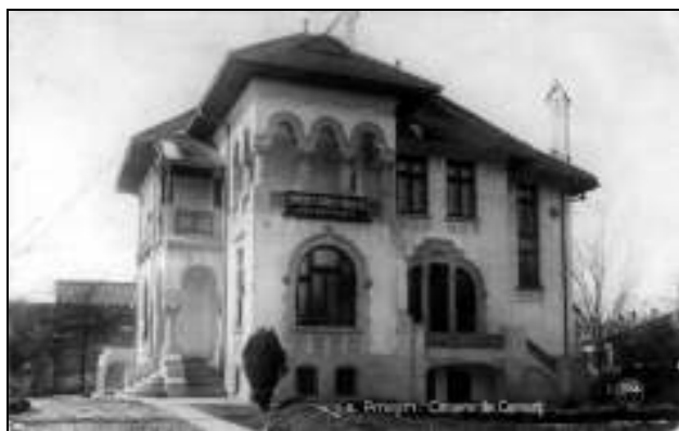
Camera de Comerț și Industrie Pitești, clădirea există și astăzi în spatele Cinema București și al Primăriei fiind cunoscută ca fostul Liceu de Arte sau Casa Coandă

elevi 26 . Cum s-a văzut, școala a avut de depășit în primii ani o serie de greutăți legate de procurarea materialului didactic pentru care profesorii au făcut sacrificii bănești, cu atât mai mari cu cât sprijinul financiar din partea altor instituții era insuficient; directorul recunoștea în august 1904 că procurarea lui reprezenta „prima întrebuintare a fondurilor de care dispune școala” 27 . Astfel, se reușise achiziționarea a 26 de hărți geografice, din care una a României, 10 tabele intuitive, doi clopoței pentru sunat, un con, un cilindru, o prismă, o piramidă, unități de măsură a lichidelor, compas, echer și un tabel colorat de măsuri și greutăți; mobilierul consta în două dulapuri cu geam pentru cărți, arhivă și mostre de mărfuri, un birou cu trei sertare, 28 de bănci, trei catedre, 10 scaune, trei table, șase cuiere de perete, un suport de umbrele, două călimări, ceas deșteptător... Idieru spunea că zestrea școlii, cuprinzând și obiecte de mobilier, 260 de volume, alcătuind un început de bibliotecă – majoritatea provenind de la „desființatul gimnaziu din Slatina”, totaliza suma de 2.500 de lei 28 .