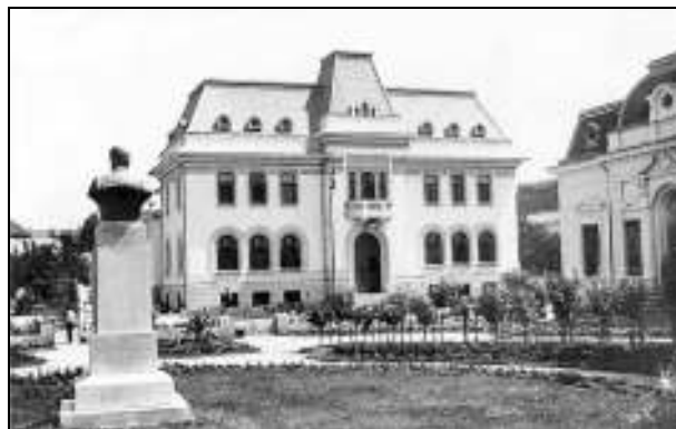
Administrația Financiară, azi Primăria Pitești

sim curaj și răsplată în mulțumirea suflatească de a fi făcut lucruri utile, nu în subvențiuni. Prin urmare... renunț la subvenția dumneavoastră, dar la ceea ce nu renunț, ceea ce cer cu multă stăruință să mi se dea este localul și cu deosebire materialul didactic cumpărat din banii noștri; materialul didactic care pentru noi va fi o evocare plăcută a unui timp prețios, utilizat în mod dezinteresat pentru binele public” 22 .