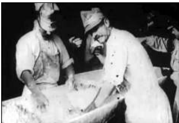
Militari români ce frământă aluatul de pâine care va fi trimis la cuptor pentru coacere – cadru din film