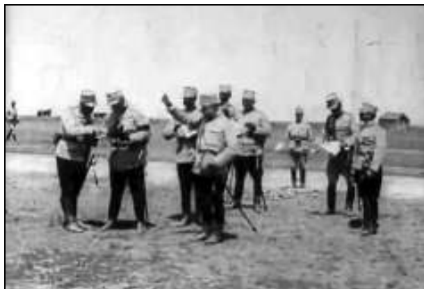
Generalul Ioan Culcer, comandantul forței militare secundare, de ocupare a Cadrilaterului, împreună cu șapte membri ai statului său major, discutând planurile pe teren și trasând indicații tactice – cadru din film