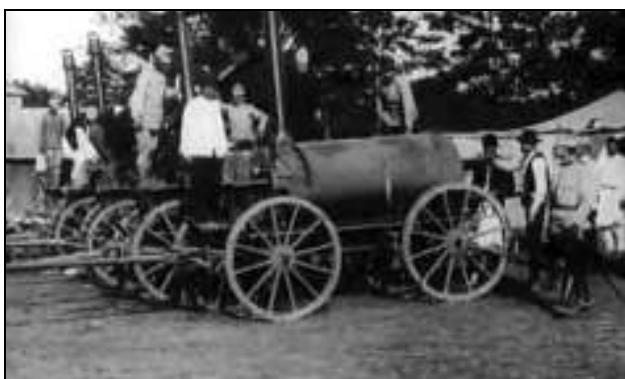
Fig. 3. – Cuptoare de campanie pentru coacerea pâinii necesare trupelor cu personalul auxiliar – cadru din film

Cea de-a doua filmare prezintă activitățile din spatele frontului. În acest caz sunt prezentate noile cuptoare militare de campanie tractabile de cai (cinci astfel de utilaje se pot vedea), împreună cu personalul de deservire, la o demonstrație de utilizare a acestora. Scenele sunt filmate la Caraomer, azi Negru Vodă în județul Constanța, după cum se prezintă pe genericul filmului. Se mai poate observa și cortul sanitar, din cadrul organizării taberei, precum și ofițeri, trupă și civili.