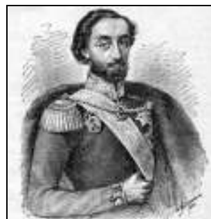
Barbu Știrbei (portretul oficial)