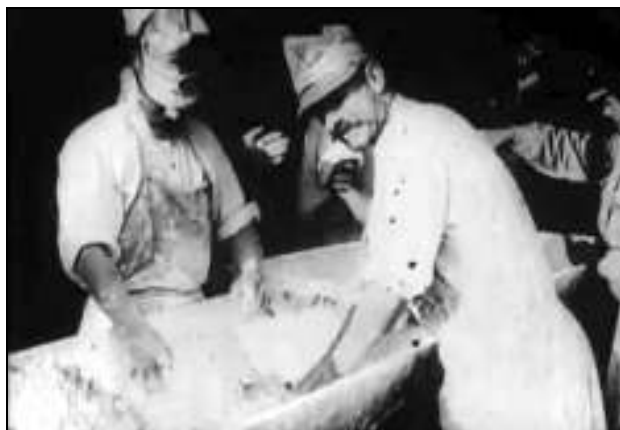
Fig. 4. – Militari români ce frământă aluatul de pâine care va fi trimis la cuptor pentru coacere- cadru din film

Tot în imagini filmate la Caraomer se mai pot vedea soldați ce frământă aluatul pentru pâine în copăi de lemn, depozitarea acestuia pentru dospit și transportul la cupatoare. Activitatea bucătăriei de campanie se desfășura neîntrerupt și în schimburi (se observă într-una din imagini o lampă cu gaz pe un suport exterior pentru iluminat nocturn).