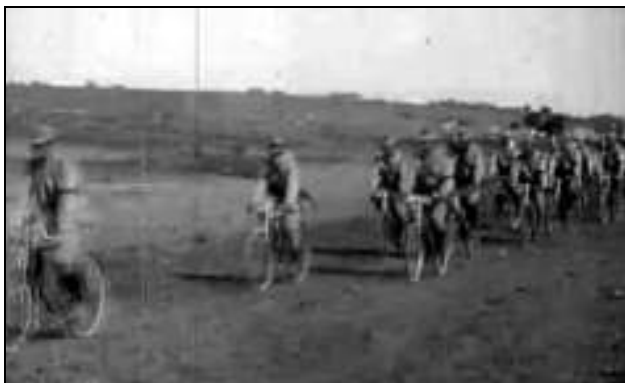
Fig. 2. – Compania de bicicliști a căpitanului Hristodulo – cadru din film

În prima parte a filmului se prezintă în acțiune compania de bicicliști a căpitanului Hristodulo care operează pe biciclete, probabil Steyr, având puști individuale, posibil de cavalerie, cu țeava mai scurtă, de tip Steyr-Mannlicher 1893/1895. Pușca Steyr-Mannlicher era în dotarea standard a armatei române, aceasta fiind folosită până în cel de-al Doilea Război Mondial. Folosirea bicicletei creștea raza și viteza de operare a infanteriei de recunoaștere, parcurgându-se chiar și 100 de kilometri pe zi.