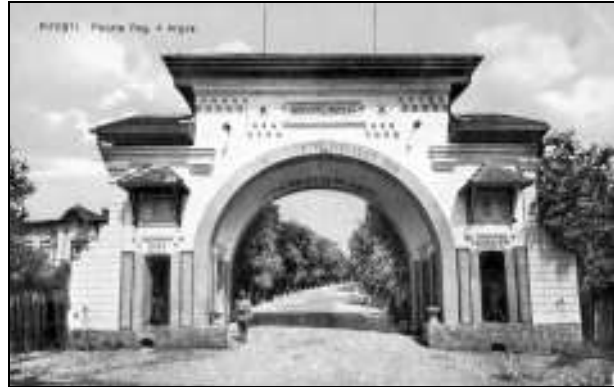
Poarta Eroilor – monument închinat eroilor Regimentului 4 Infanterie și care străjuia calea de acces în unitate