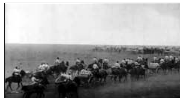
Fig. 7. – Baterii de tunuri de câmp Krupp, tractate de cai, efectuând manevre – cadru din film

Ca tehnică cinematografică de filmare se poate menționa tehnica de filmare cu camera imobilă dar și cu mișcarea camerei în jurul axei verticale (rotire), vederea de