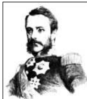
Alexandru Ioan Cuza (portret de August Strixner)