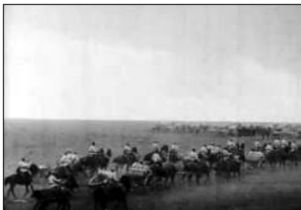
Baterii de tunuri de câmp Krupp, tractate de cai, efectuând manevre – cadru din film