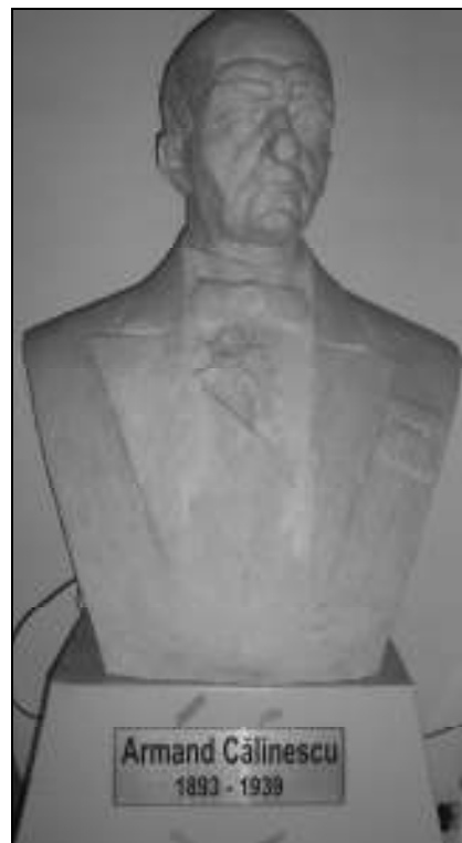
Bustul lui Armand Călinescu din Pitești

ori. Dar nu participă la această acțiune. Ei nu sunt intim legați de aceste acțiuni. 12 Din acest motiv, încercând să confere noului regim politic și un suport social, la propunerea lui Armand Călinescu, la 16 decembrie 1938 s-au pus bazele Frontului Renașterii Naționale, unica formațiune politică autorizată, primul partid de masă, în opinia inițiatorilor săi. Apărea astfel un partid care pretindea că exprimă interesele tuturor cetățenilor statului român. Șeful suprem al partidului era regele, conducerea era asigurată de un Consiliu Superior alcătuit din 150 de membri, un Directorat cu 30 de membri și trei secretari generali. 13