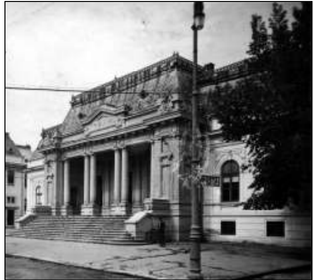
Curtea de Apel Pitești în perioada interbelică

nală a unui sistem care în orice moment încearcă adecvarea la scopul său ca valoare, realizarea dreptății, justiția se regăsește în adevărul sau, altfel spus își dă propria legitimitate, fără a aștepta ca acesta să-i fie dată, în forme uneori inadecvate, din afară.