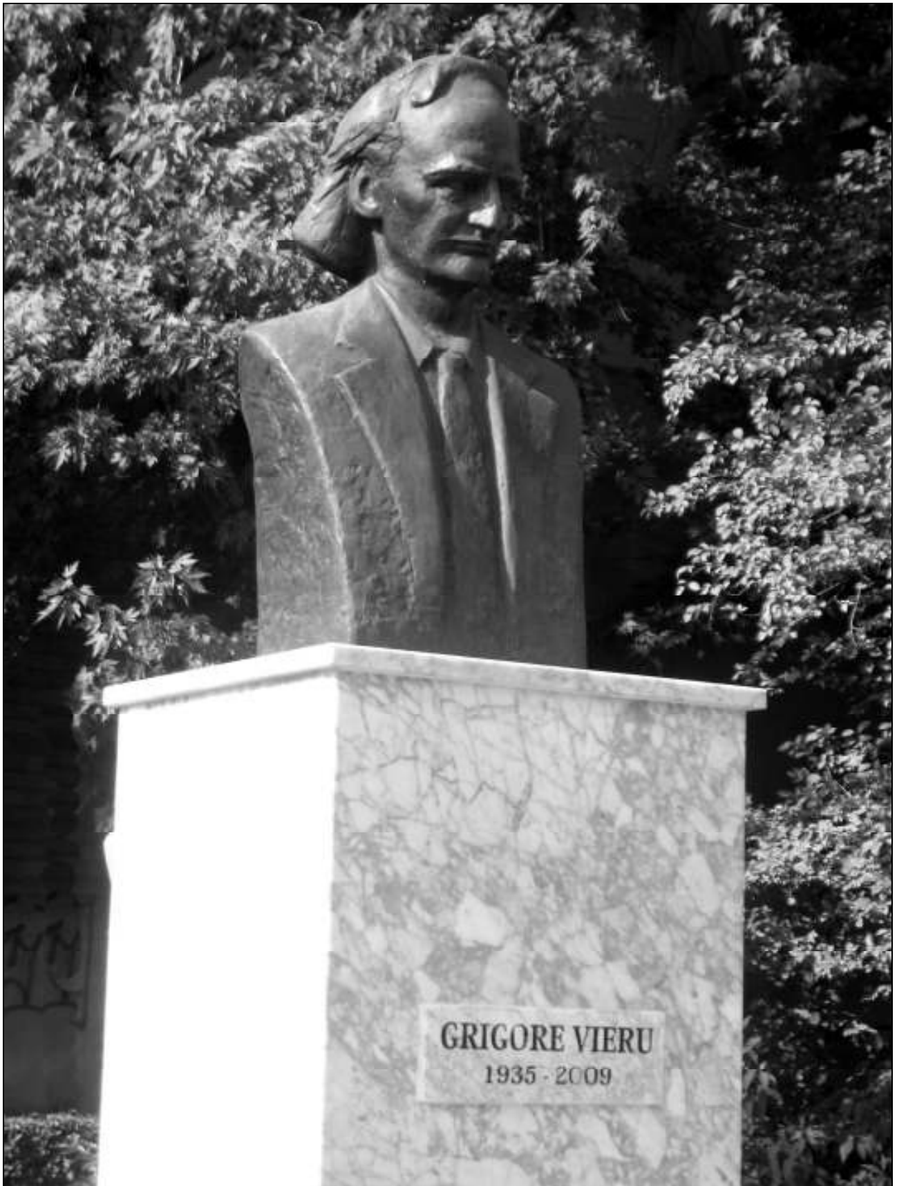
Grigore Vieru – bust comemorativ pe soclu de marmură, amplasat în zona Curții de Conturi Pitești