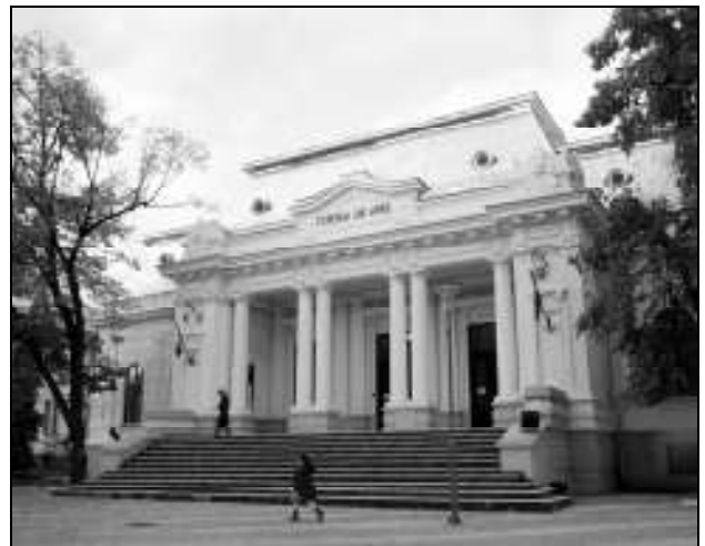
Curtea de Apel Pitești (2013)

Contradicțiile și în general orice disfuncționalitate în coerența sistemului sau neadecvarea la scop sunt maladii, curențe ale justiției, care o depărtează de la rostul și adevărul ei. Atunci când maladiile justiției devin cronice, dar cu manifestări ce duc spre acutizare, putem vorbi de o criză a sistemului de justiție. Justiția noastră se află evident într-o astfel de criză cronică cu tendințe de acutizare. Principala cauză o constituie contradicțiile maladive ale sistemului. Spre deosebire de contradicțiile benefice care dau devenirea, cele maladive tind să depărteze tot mai mult justiția de la realitatea și adevărul ei. Încercăm în cele ce urmează să punem în evidență contradicțiile ma-