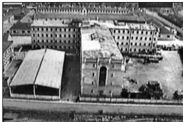
Închisoarea de la Pitești

9. Scoaterea organizațiilor și a însemnelor comuniste în afara legii;