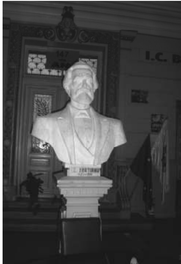
Bustul lui I.C. Brătianu amplasat în holul Colegiului Național care-i poartă numele