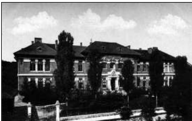
Colegiul Național „I.C. Brătianu”