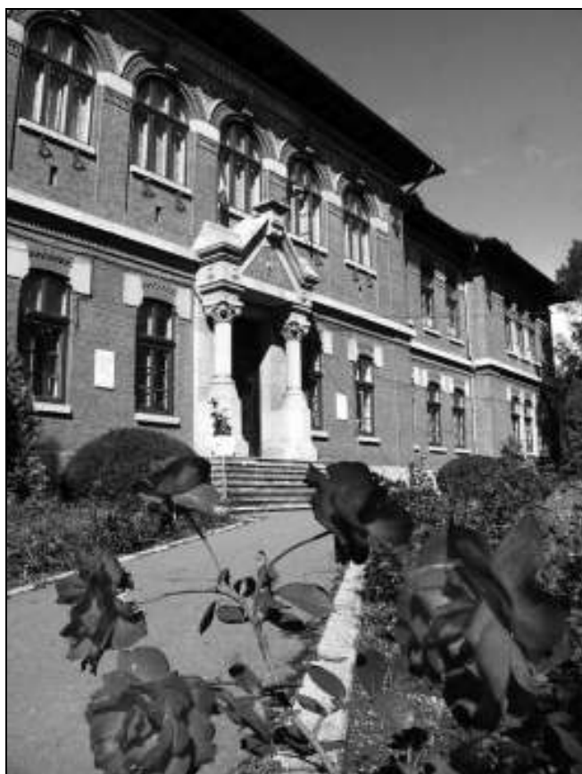
Colegiul Național „I.C. Brătianu”