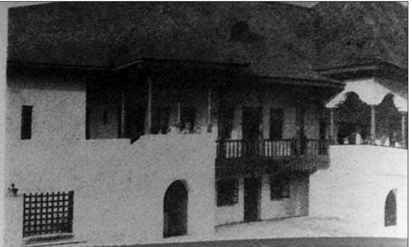
Veche casă în stil românesc din Cimpulung.

tuale, de monumente de arhitectură. Astăzi, încă, trebuie remarcată coexistența unei arhitecturi populare vechi, alături de una orășenească mai nouă, inclusiv exemplare de tranziție, în unele orșe ale regiunii, ca: Kimnicu Vilcea, Curtea de Argeș, Cimpulung mai ales, Pitești chiar. După cum sub ochii noștri, „vechi sate, în dezvoltare treptată păstrează, actualizând ocerăși veche arhitectură populară: Hurezu, Olănești, Domnești, Lerești, Colibași, Mioveni și mai ales Rucăr.