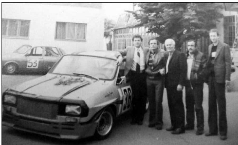
Fotografie cu o parte a „familiei” alergătorilor, în curtea de pe str. Sf. Vineri, unde își avea sediul ITA Argeș.