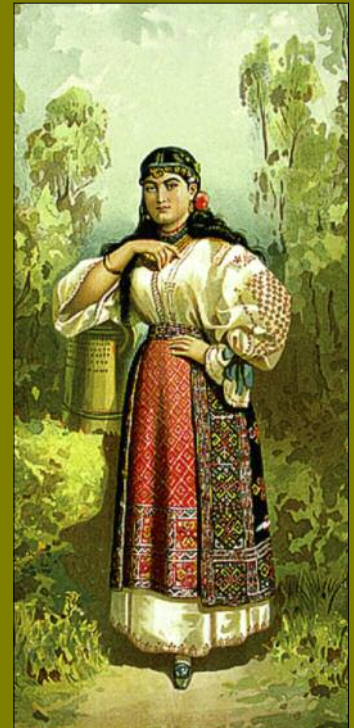
Țărancă din Argeș (Carol Pop de Szathmari)