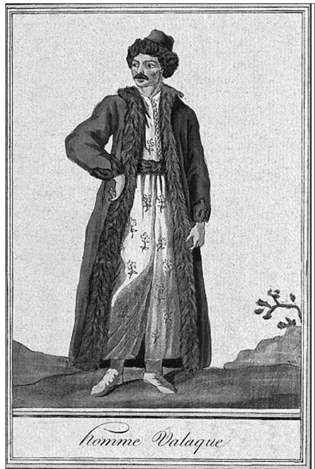
Femeie și bărbat valahi (Jacques Grasset de Sain Sauveur, finalul sec. XVIII)