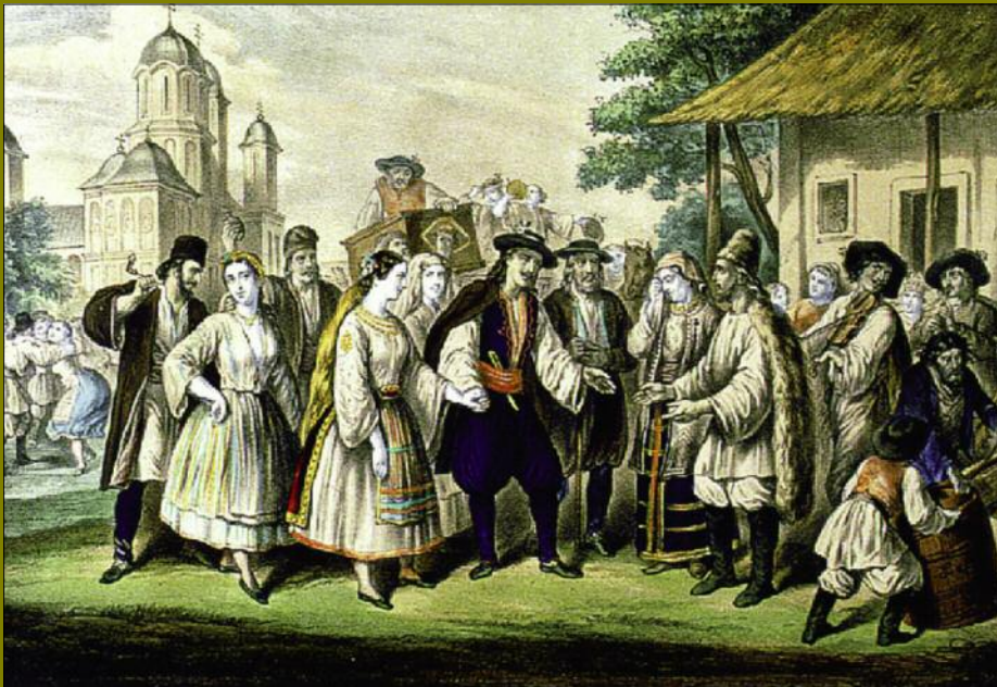
O nuntă în Țara Românească (Karl Lanzedelly)

Anul XIV ■ Nr. 1 (39)/2016 Serie nouă ■ 4 lei