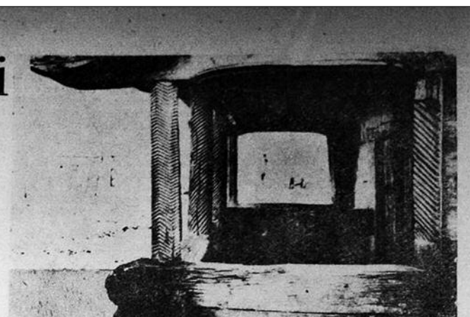
Stilpii casei din Românești, sculptați de Brâncuși

Ca o completare a acestor certificate, Brâncuși a mai anexat un certificat din 10 noiembrie 1905 cu următorul text: „Ministerul Instrucțiunii Publice al Artelor Frumoase și Culetelor — Republica Franceză — Școala Națională a Artelor Frumoase — Paris 10 Noiembrie 1905 — Directorul Școlii Naționale de Arte Frumoase, Membru al Institutului, Subsemnatul, certific: la 23 iunie trecut, d-l Brâncuși C-tin, a fost primit ca elev de d. Mercie, profesor șef de atelier de sculptură, și că din acel timp el studiază regulat la școala sub direcțiunea maestrului care dă cele mai bune dovezi despre