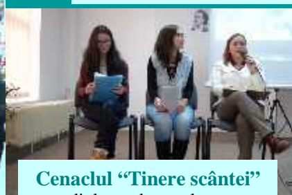
Cenaclul "Tinare scânteii" - diplom de excelen -