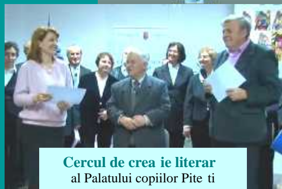
Cercul de crea ie literar al Palatului copiilor Pitești - diplom de excelen -