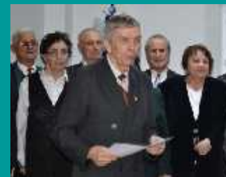
Grupul vocal "Armonia" - diplom de excelen -