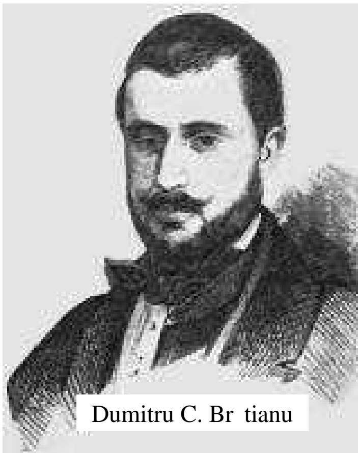
Dumitru C. Brătianu

În ziua de 25 ianuarie 1859, prin decret domnesc, D. Brătianu a fost numit ministru secretar de stat al țării Românești, ca o încununare a eforturilor sale în înfiptuirea marelui act istoric. La scurt timp după înfiptuirea Unirii și alegerea domnitorului, Cuza îi înșcrăcează pe Nicolae Golescu și ultraconservatorul Alexandru Filipescu cu formarea noului guvern din care fac parte și liberalii și conservatorii. D. Brătianu este numit ministru de externe, iar primul demers pe care-l face pe lângă domnitor, înaintează un raport pentru desființarea cenzurii.