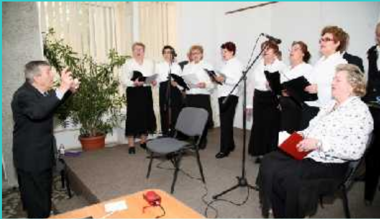
În martie, grupul vocal “Armonia” , component al cenaclului “Armonii carpatine” , a avut un repertoriu dedicat doamnelor i domni oarelor.