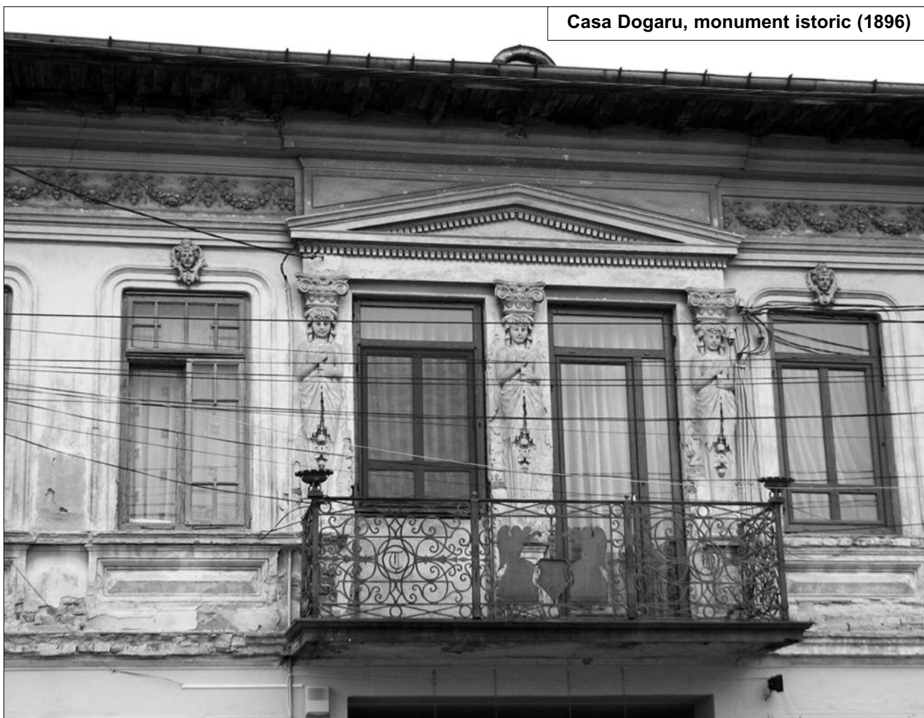
Casa Dogaru, monument istoric (1896)