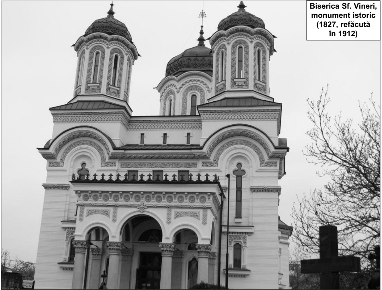
Biserica Sf. Vineri, monument istoric (1827, refăcută în 1912)