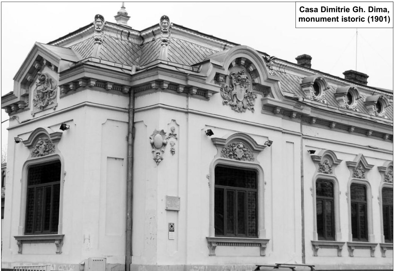
Casa Dimitrie Gh. Dima, monument istoric (1901)