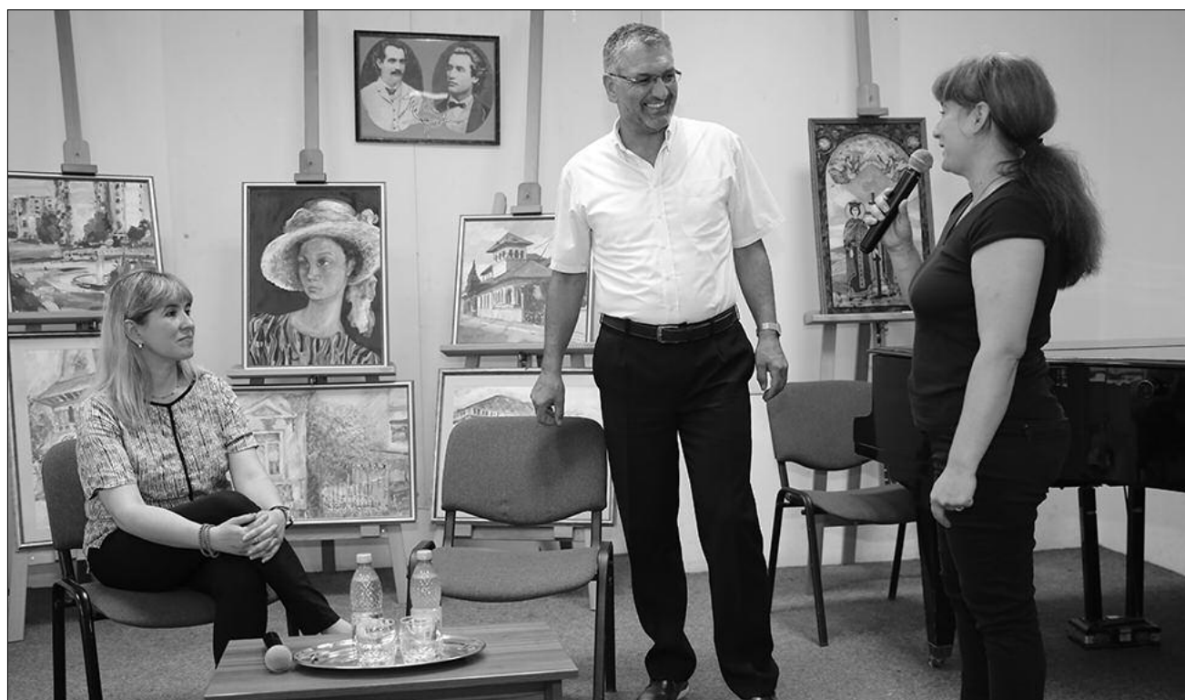
Conferința cu tema Armonia și fraternitatea interumană cu prilejul zilei de naștere a PSS Dalai Lama.

Consiliul Local al Municipiului Pitești întrunit în ședință ordinară;