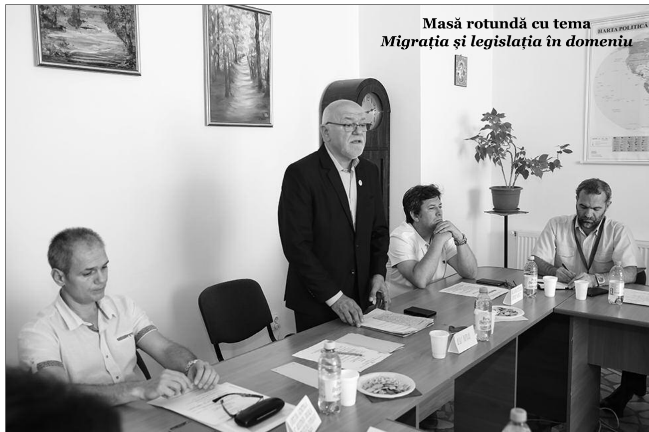
Masă rotundă cu tema Migrația și legislația în domeniu