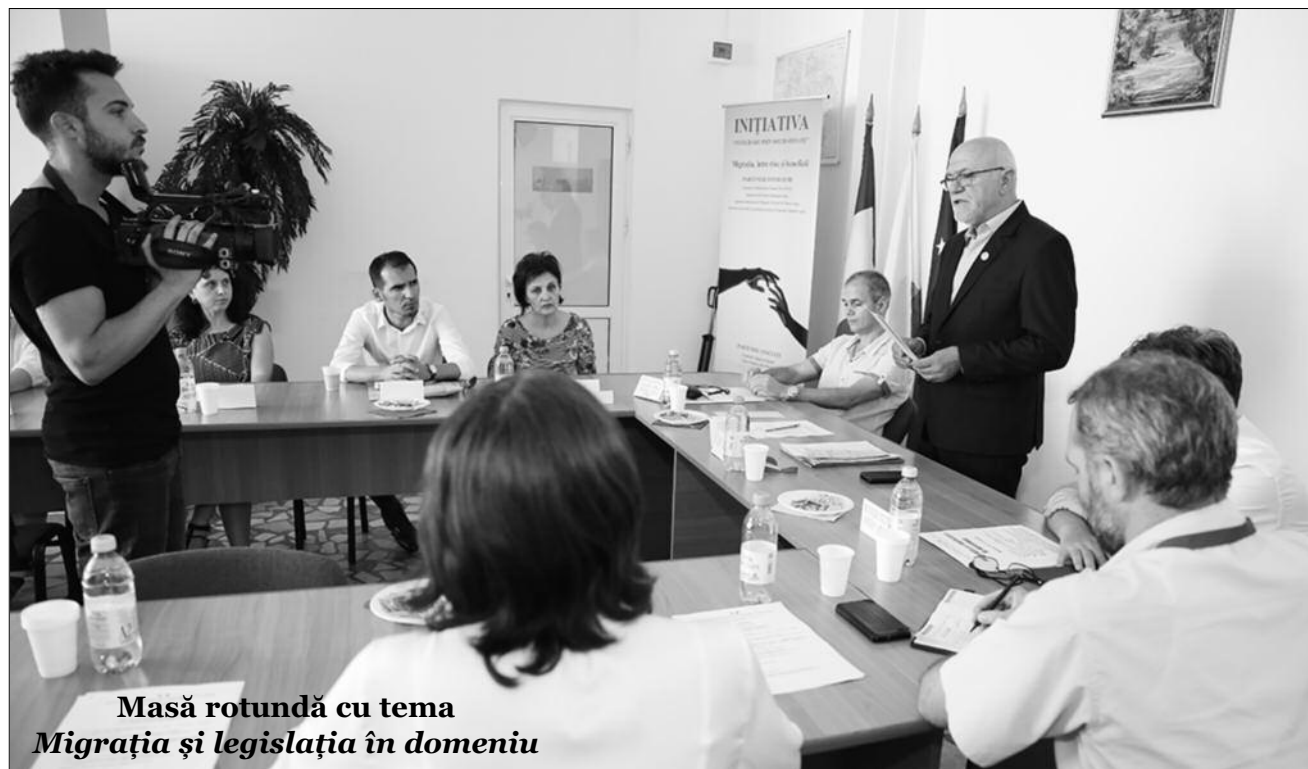
Masă rotundă cu tema Migrația și legislația în domeniu

- Avizele comisiilor de specialitate ale consiliului local cuprinse în rapoartele nr. 30869/2017, nr. 30870/2017, nr. 30871/2017, nr. 30872/2017 și nr. 30873/2017;