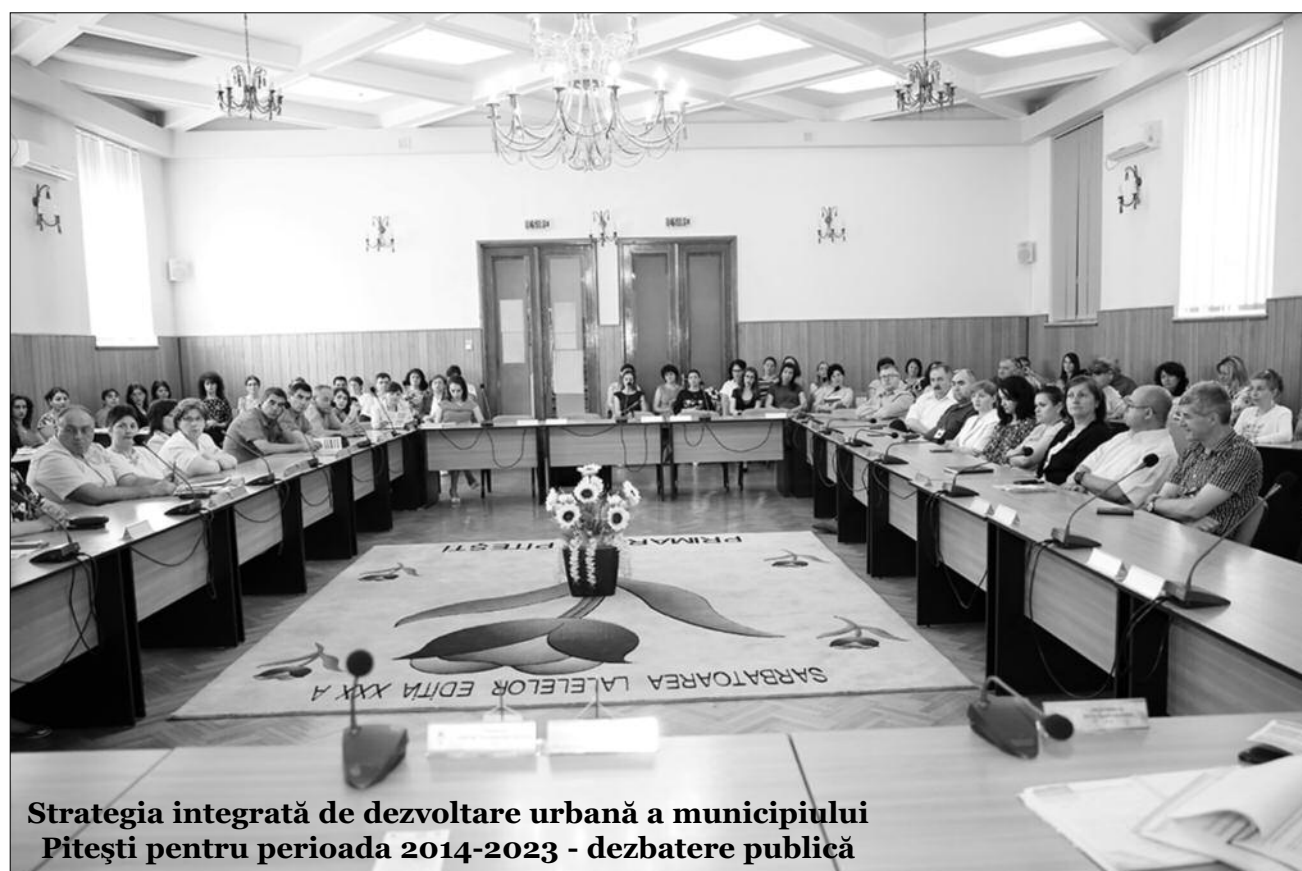
Strategia integrată de dezvoltare urbană a municipiului Pitești pentru perioada 2014-2023 - dezbatere publică

- Expunerea de motive a Primarului Municipiului Pitești;