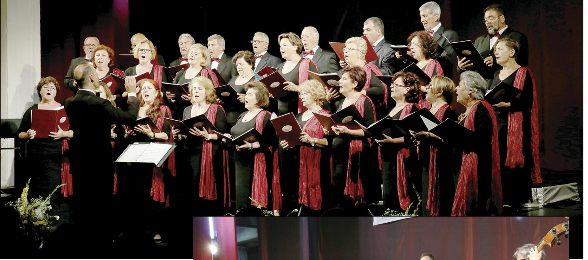
Ediția XXV, Pitești, iulie 2017