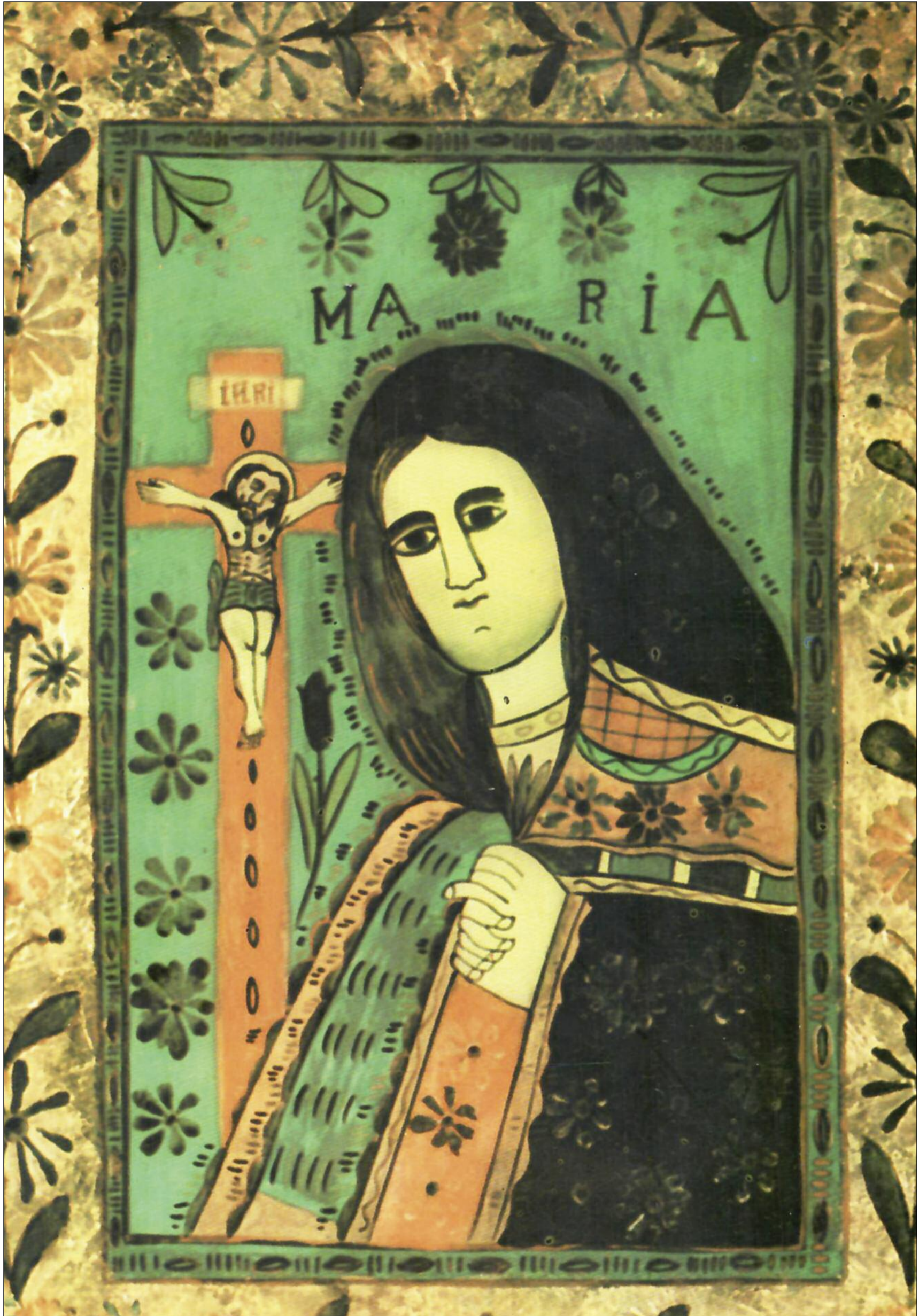
MAICA DOMNULUI. Icoană pe sticlă, Mănăstirea Nicula

Apare sub egida Uniunii Scriitorilor din România