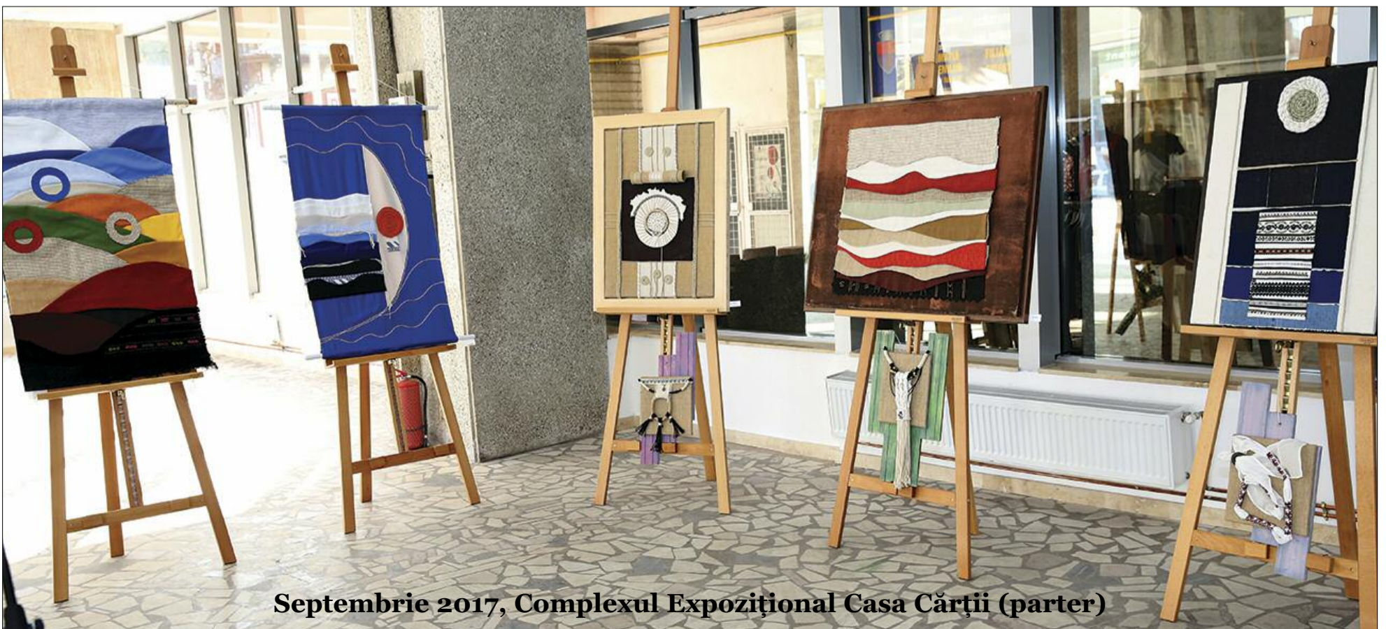
Septembrie 2017, Complexul Expozițional Casa Cărții (parter)