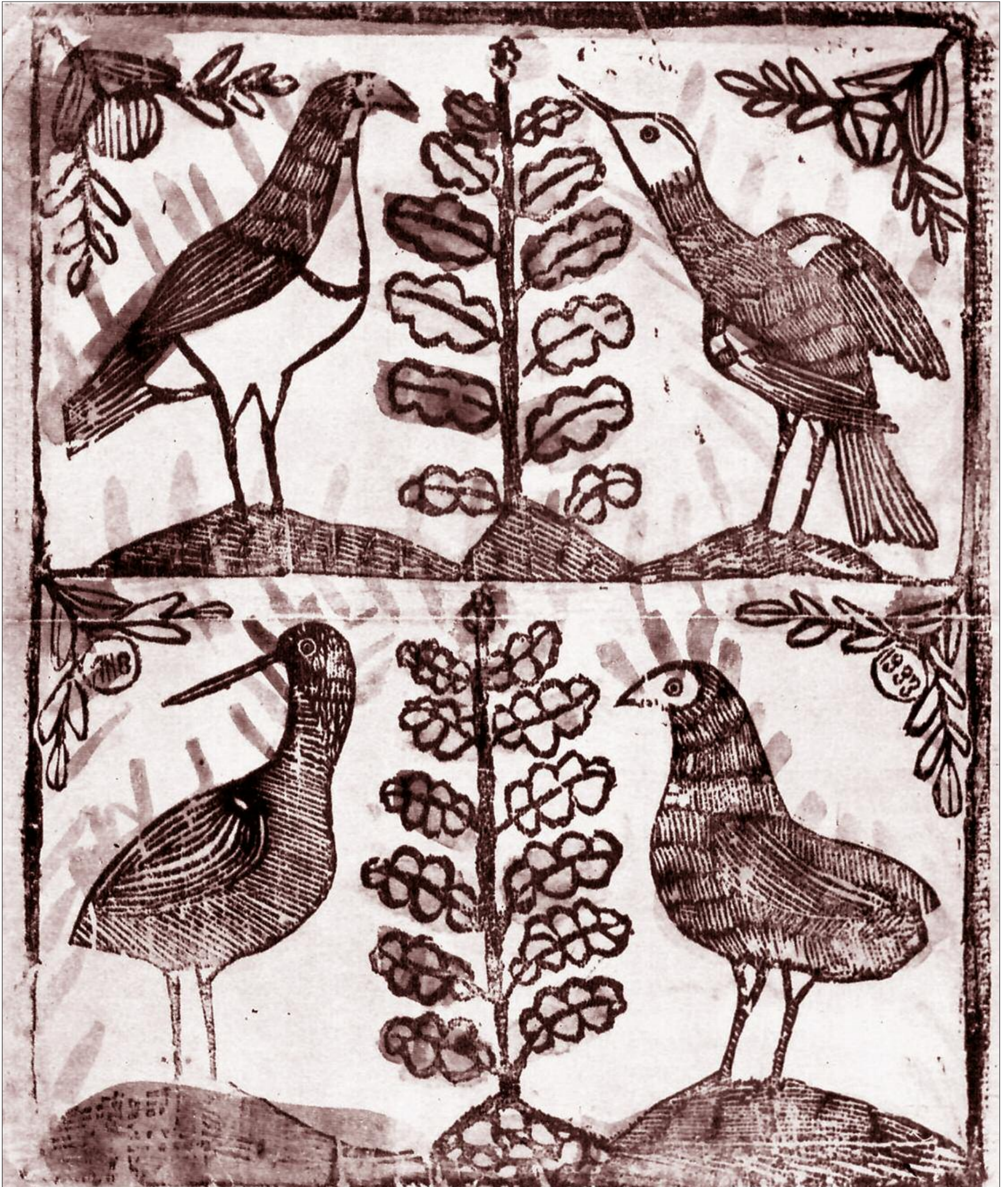
ANONIM. PATRU PĂSĂRI. 1883. (Din volumul Xilogravura populară din Transilvania în sec. XVIII-XIX, 1970)

Apare sub egida Uniunii Scriitorilor din România