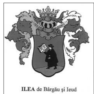
ILEA de Bărgău și Ieud

Orice persoană, cred eu, fie muncitoare, trîndavă ori literată sau din afara peisajului literar e: cinstită sau hapsînă, sau excroacă sau corectă, dar dacă are talent poate publica pe banii ei orice poem prost sau mai puțin bun, deoarece nu există o selecție, principiile fiind hapsîne, bazate pe finanțe, dar domnule ‘Infanterist’, nu așa se face literatură.