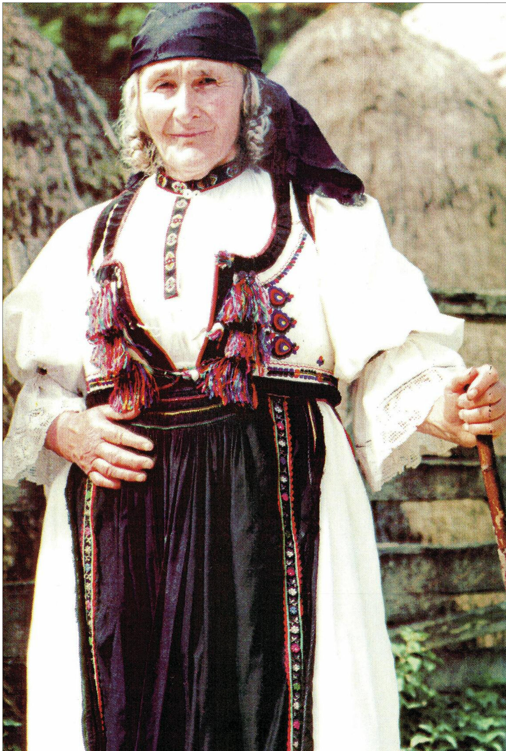
Port popular din Ocolîș (din vol. Comunicare și cultură. Album de etnografie și folclor. Țara Moșilor, România, vol. I, apărut sub egida Societății Cultural-Patriotice Avram Iancu, Alba Iulia, 1997 )

Apare sub egida Uniunii Scriitorilor din România