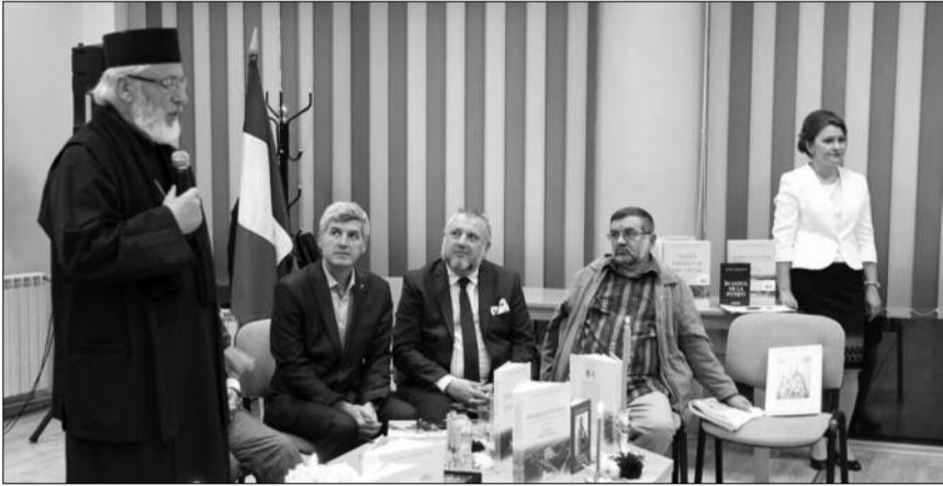
Dar din dar