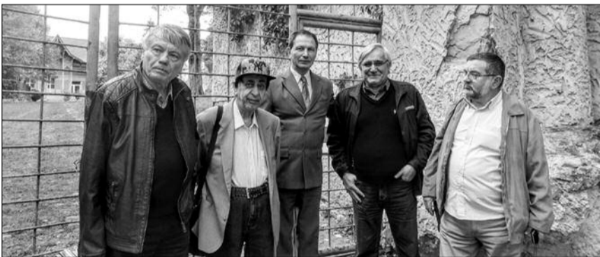
Ultima fotografie a lui Gheorghe Izbășescu, din 28 septembrie, în fața clubului elevilor din Onești, alături de membrii juriului concursului de proză scurtă „Radu Rosetti”

evocată o operă literară de patru decenii. Dar, vorbim de integrala Calinic de până la 2017, că altfel autorul e în plină forță creatoare și scrie zilnic.