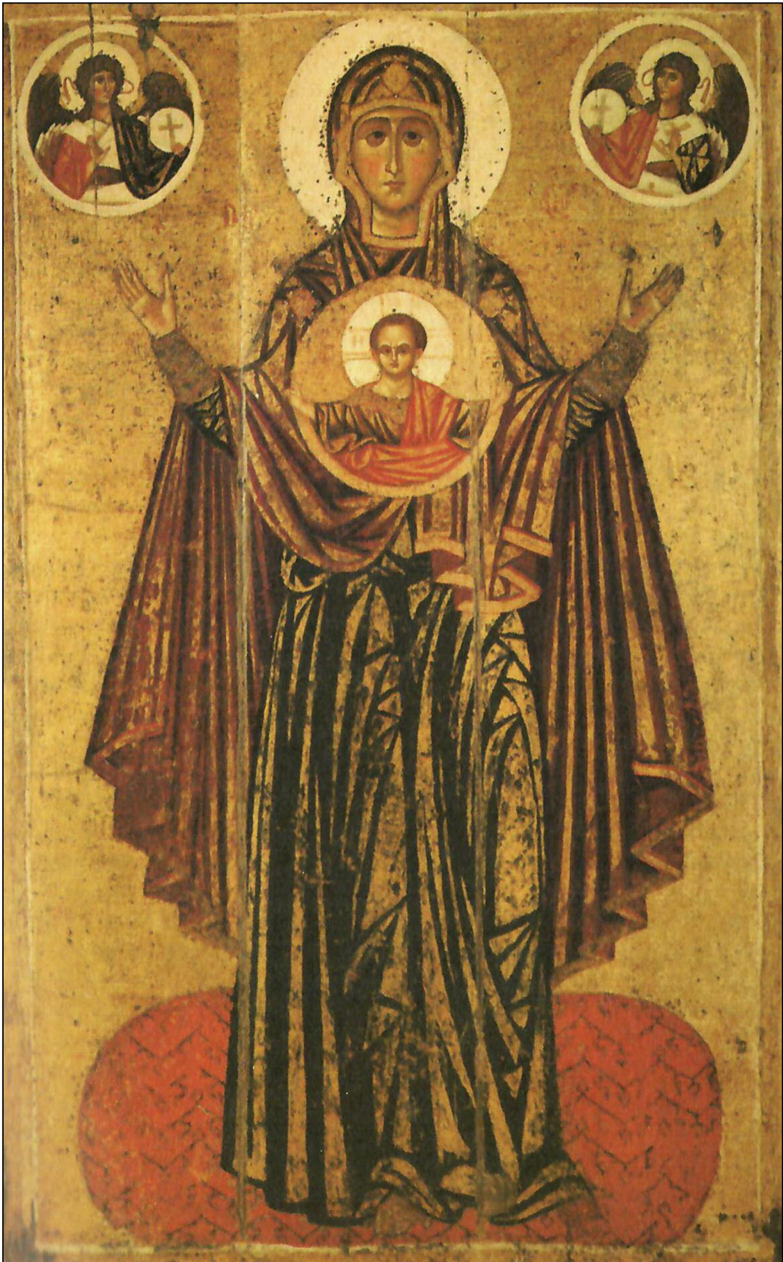
Sfânta Fecioară din Iaroslav. Galeria Tretiakov, sec. XII-XIII.

Apare sub egida Uniunii Scriitorilor din România