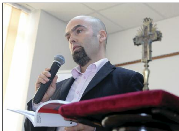
Centrul Cultural Pitești, aprilie 2018