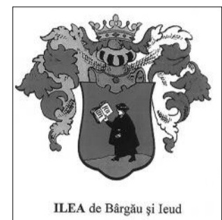
ILEA de Bărgău și Ieud

Stimate tată Sentslai Adalbert, Îți scriu astăzi, 3 septembrie, anul 2010, deși ar trebui să-ți spun verde și în față cele mai de jos că locuim împreună în trei camere, bucătărie, baie, curte, pe strada Libertății, la numărul optsprezece, în orașul Baia-Sprie.