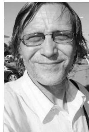
(n. 16 februarie 1951, București - 13 mai 2014, București)

Secolele au pierit, scurgându-se în clepsidra cosmică. Mileniile au răsturnat și ele giganticul ornice ceresc. Vizitecii nu mai erau decât o parabolă încărcată de tâlcuri morale, amintire ancestrală, aiureală impietând circulația informației în Complexul Planetar de Stocare și Sistematizare a cristalelor macroprocesoarelor Megasimulatorului de Variante.