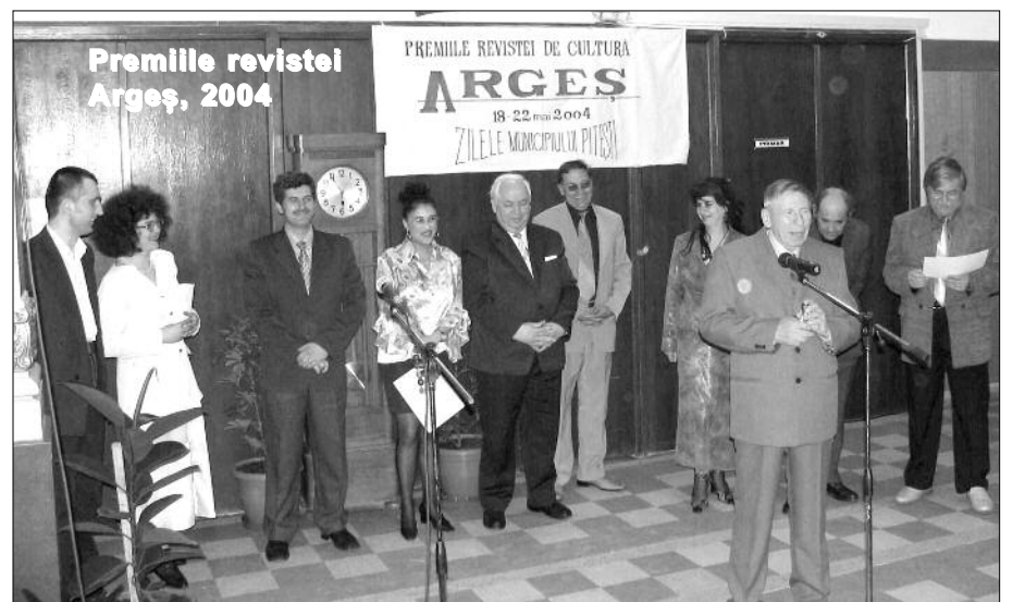
Premiile revistei Argeș, 2004