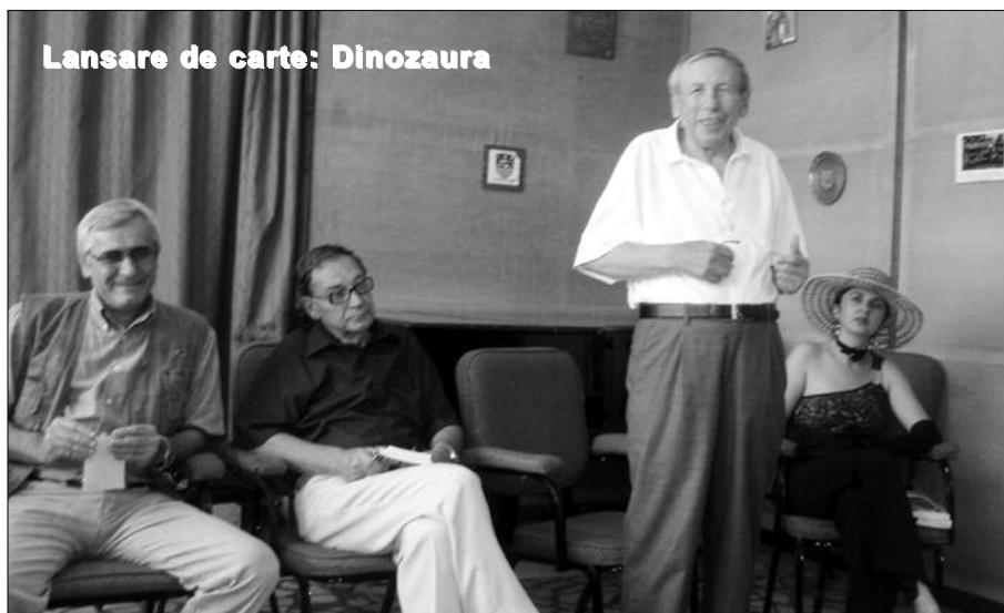
Lansare de carte: Dinozauri