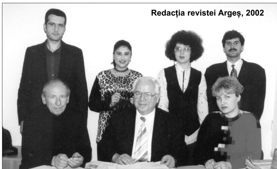
Redacția revistei Argeș, 2002