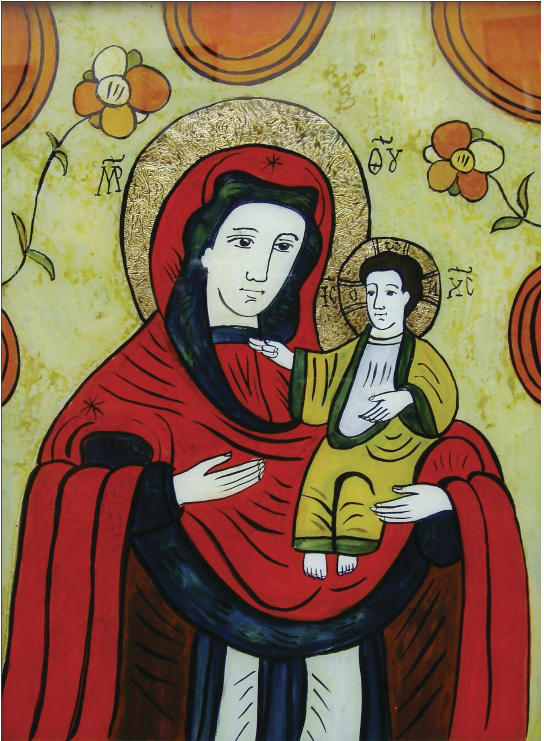
Icoană pe sticlă de la Mănăstirea Stavropoleos

Apare sub egida Uniunii Scriitorilor din România