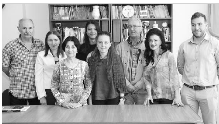
Leoaică tânără, iubirea...