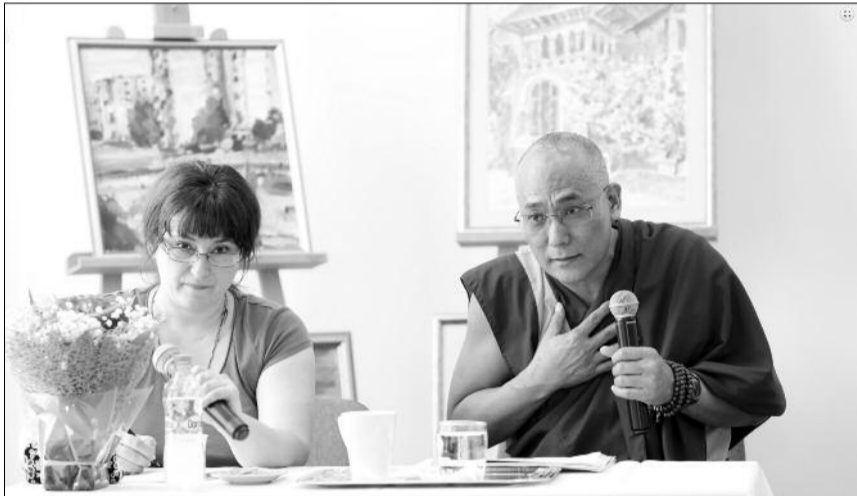
„Întâlnire cu spiritualitatea tibetană”