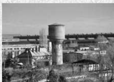
Mențiune - Diac Mihai