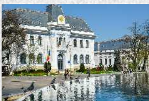
Locul al III-lea - Eduard Crăciunel