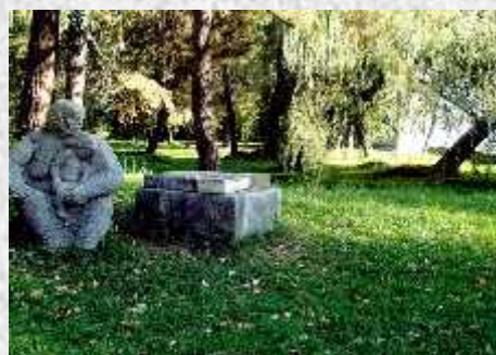
Locul al II-lea - Dumitrescu Mihai